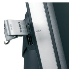
Nahaufnahme eines USB Ports