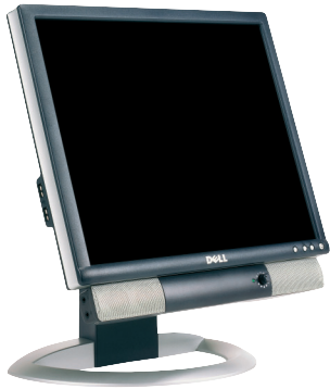
1704FPT mit AS500 Soundbar