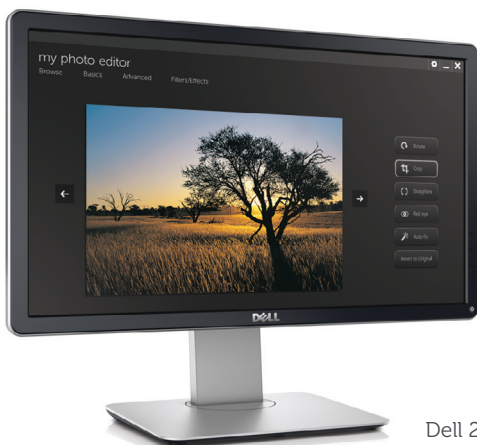
Dell 20 Monitor | P2014H (19,5 Zoll, 49,41 cm VIS)