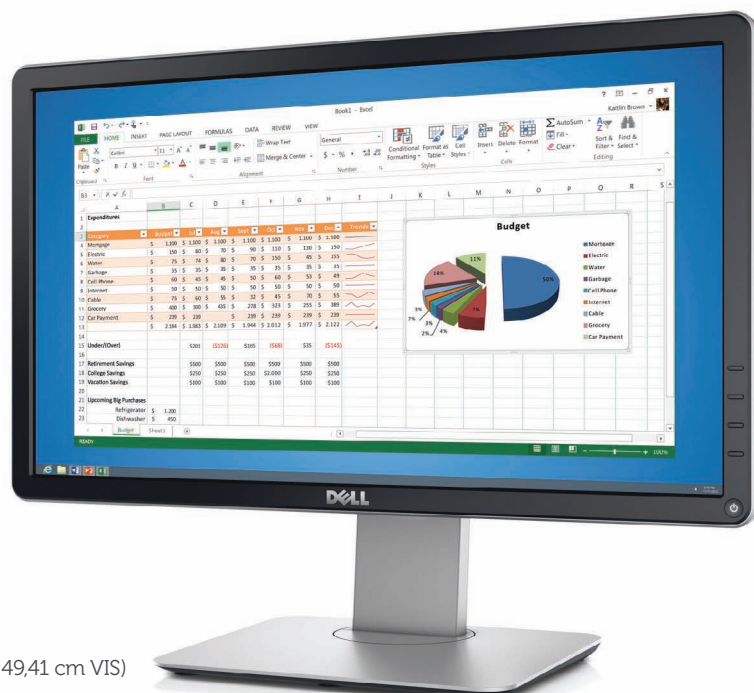
Dell 20 Monitor | P2014H (19,5 Zoll, 49,41 cm VIS)