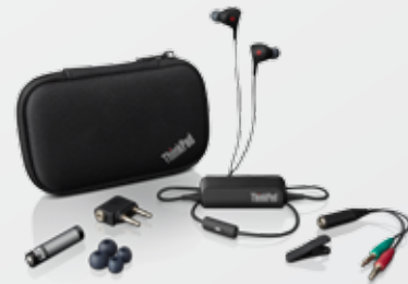
ThinkPad Ohrhörer mit Geräuschunterdrückung