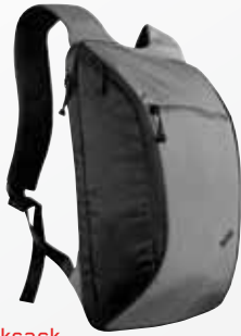
ThinkPad® Ultralight Rucksack