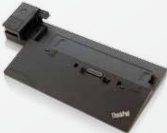
Neue ThinkPad Dockinglösung für Sicherheit, Anschlussmöglichkeiten und Stromversorgung