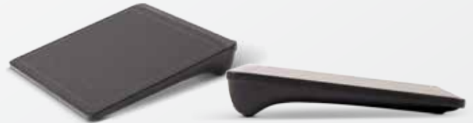
Lenovo® Wireless Touchpad (für Modelle ohne Touch-Funktionalität)