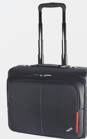
ThinkPad Radiant Roller – Best.-Nr.: 78Y2375