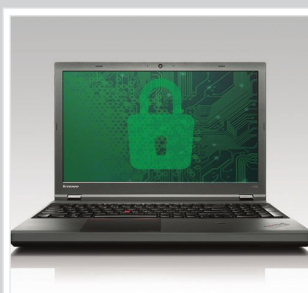
NOCH EINFACHERE BEDIENUNG Sofort einsatzfähig Intel® vPro™ erleichtert IT-Mitarbeitern die Verwaltung und steigert die Sicherheit