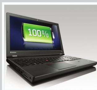
PRODUKTIVES ARBEITEN Mehr als 13 Stunden Akkulaufzeit

Das Lenovo® ThinkPad® T540p ist ein exzellentes Notebook für Unternehmen. Mit Intel® Core™ Prozessoren der vierten Generation, bis zu 1 TB Speicher und mindestens 13 Stunden Akkulaufzeit meistert es auch anspruchsvollste Workloads. Steigern Sie die Produktivität mit der ThinkPad Präzisionstastatur und dem großen Trackpad, das Windows 8-Gesten unterstützt. Das 39,6 cm (15") Display ist mit 3K-, HD- oder Full-HD-Auflösung erhältlich und bringt alle Anwendungen optimal zur Geltung.