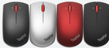
ThinkPad Precision Wireless-Maus – Midnight Black 0B47163; Heatwave Red 0B47165; Frost Silver 0B47167; Graphite Black 0B47168; Midnight Black 0B47153