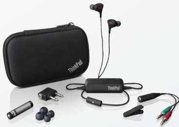
ThinkPad® Ohrhörer mit Geräuschunterdrückung (0B47313)