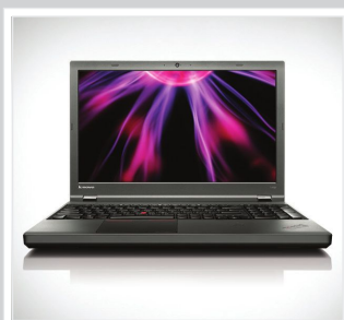
BESSERE ANZEIGEQUALITÄT Displayoptionen mit HD-, Full-HD- und 3K-Auflösung für lebensechte Darstellung